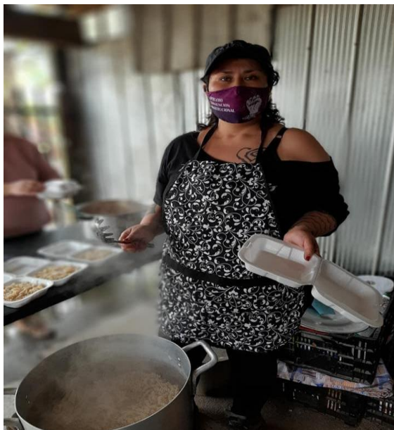
IMAGEN N° 3 POBLADORA PARTICIPANDO DE OLLA COMÚN EN LA CIUDAD DE OSORNO