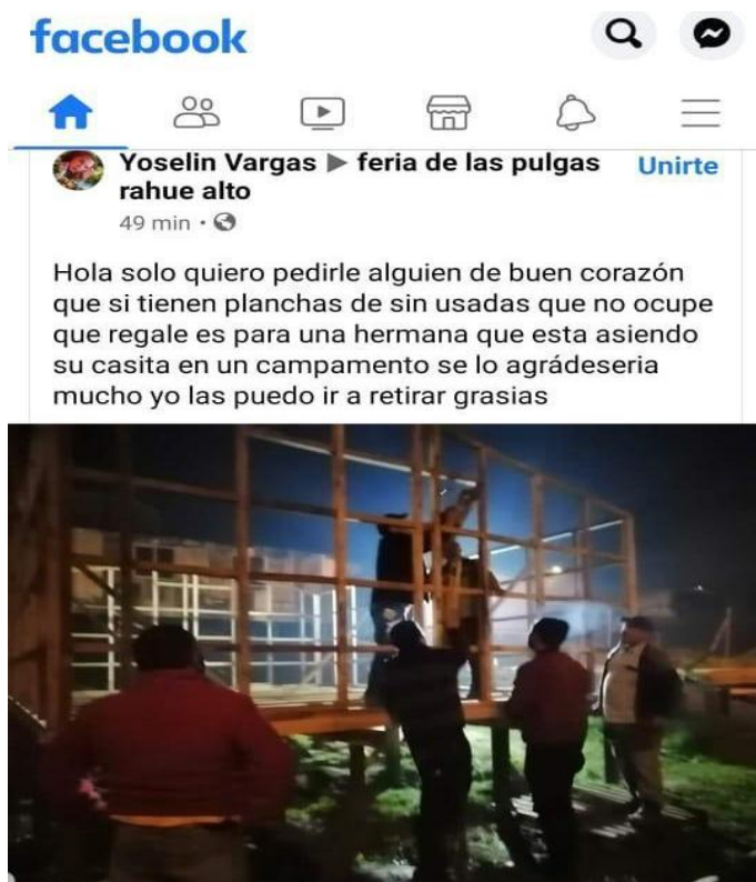
IMAGEN N° 2 SOLICITUD DE DONACIÓN DE MATERIALES DE CONSTRUCCIÓN A TRAVÉS DE REDES SOCIALES