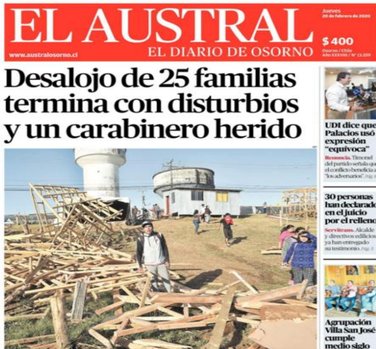
IMAGEN N° 1 DESALOJO DE FAMILIAS EN CIUDAD DE OSORNO