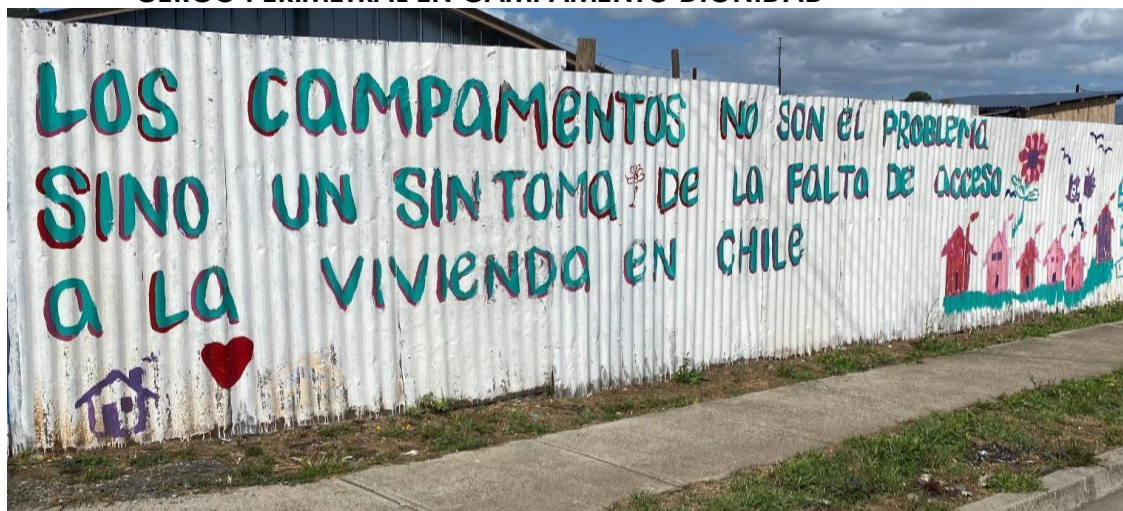
IMAGEN N°4 CERCO PERIMETRAL EN CAMPAMENTO DIGNIDAD

Finalmente, un hito clave en el tránsito hacia la consolidación de los asentamientos fue la construcción de cierres perimetrales, pensados originalmente como barreras de protección ante desalojos, pero que progresivamente adquirieron funciones múltiples: proteger frente a robos, cuidar a niños y niñas, y reforzar la identidad comunitaria. Su construcción se sustentó en campañas autogestionadas, con aportes de vecinos, familiares, voluntarios y donaciones externas gestionadas por redes sociales.