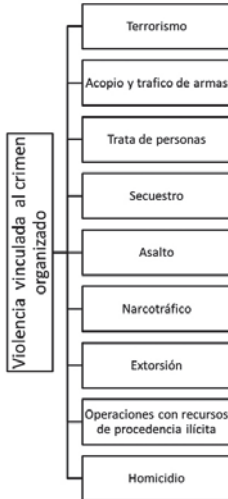
Figura 1. Clasificación inicial de la violencia vinculada al crimen organizado