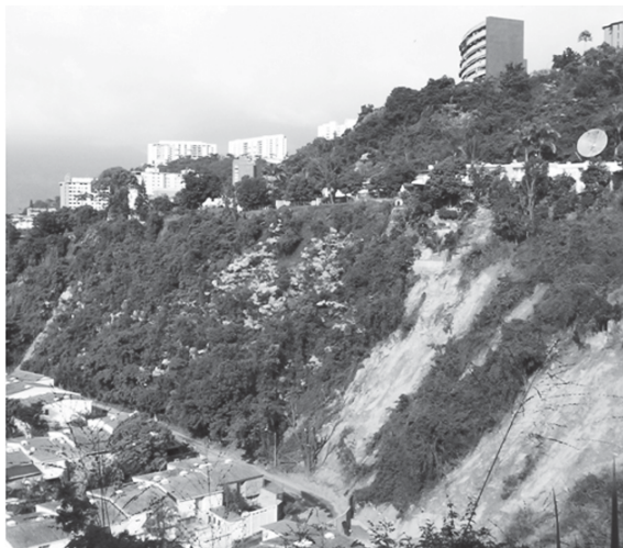
Figura 5: Urbanización Santa Inés al pie de un relleno con deslizamiento activo

La presión sobre la tierra es otro de los factores de producción de los deslizamientos en Caracas. A mediados de los años 1970, en pleno boom petrolero de la Venezuela Saudita, los terrenos más asequibles del fondo del valle se encuentran saturados. No quedan más soluciones que ocupar masivamente las colinas del valle de Caracas. Por ley, el material residual de los trabajos de excavación para contar con terrenos planos en la cima de las colinas debe ser evacuado por el constructor. Sin embargo, ahorrando gastos para constructores y ganando terreno vendible para los promotores, en muchos casos el material excavado termina siendo botado al borde de los terrenos, ampliando las superficies planas de construcción y aumentando los rellenos de fuerte pendiente y de material poco consolidado. Esa es precisamente la genealogía del deslizamiento que amenaza la urbanización formal y de clase media de Santa Inés (Figura 5). Para estabilizar el deslizamiento que llega abajo en los patios de las casas, hasta se ha intentado clavar el relleno con pilares de hormigón armado. Pero los pilares no pueden pasar de 30 metros, y no son suficientemente largos como para alcanzar las capas estables debajo del relleno.