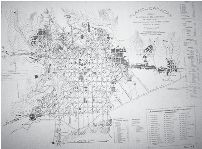
Figura 2: Primeras urbanizaciones en la ribera derecha del río Guaire, al Sur (1906)