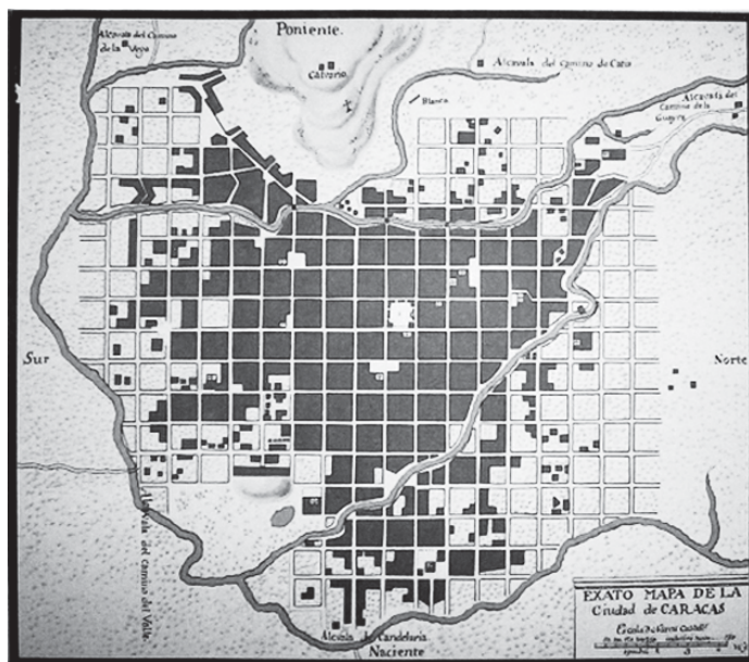
Figura 1: “Mapa Exacto” de Caracas (1772)