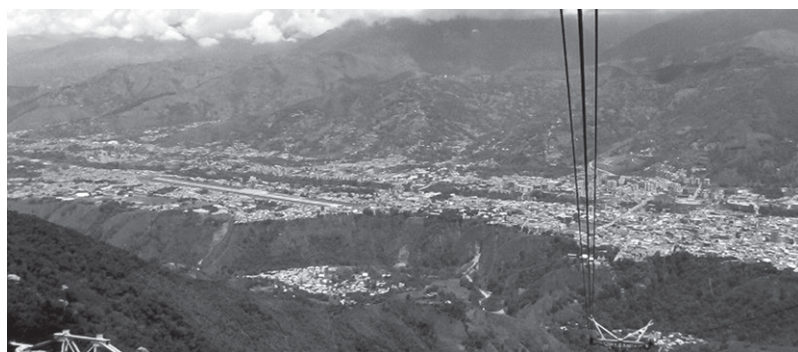
Figura 7: Vista de Mérida hacia el oeste, desde el teleférico

en el primer plano, la terraza aluvial y la pista del aeropuerto, una zanjada verde que corresponde al cañón del Albarregas, y el resto de la aglomeración al pie de la sierra de la Culata en el fondo. En caso de sismo, una de las particularidades de la ciudad de Mérida radica en su incomunicación potencial con el exterior del valle, por un difícil acceso aéreo, y en la posible fragmentación del tejido urbano, en particular entre la terraza y el resto de la aglomeración. Es de suma importancia anticipar las zonas más afectadas, y potencialmente incomunicadas para almacenar material y recursos en previsión de un desastre.