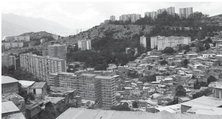
Figura 3: El valle de Caracas, desde el Oeste, Barrio Mario Briceño