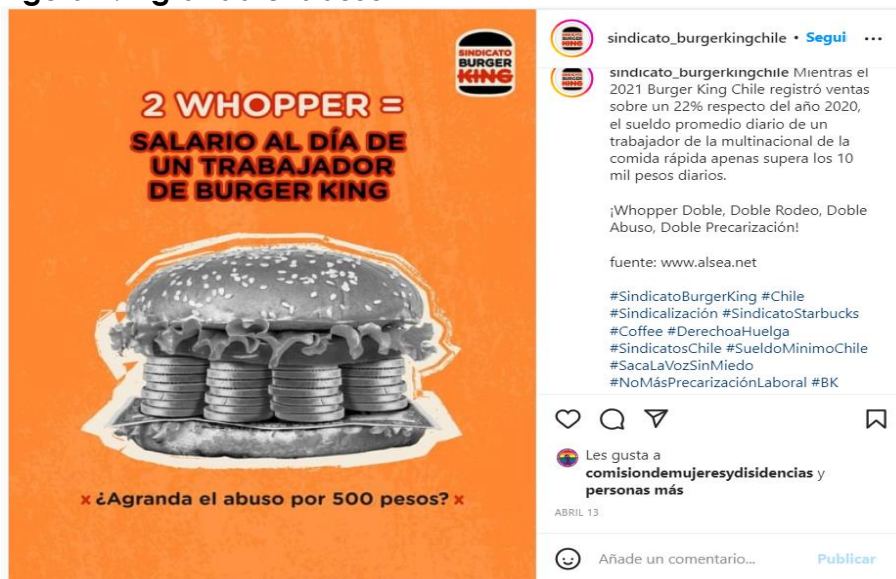
Figura 4: Agranda el abuso