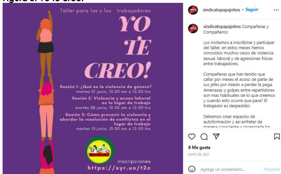
Figura 5: Yo te creo!