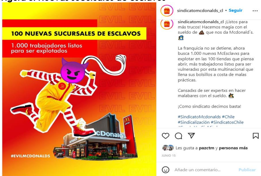
Figura 3: Nuevas sucursales de esclavos