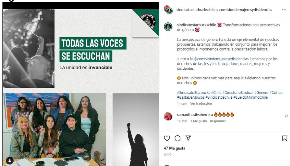
Figura 6: La unidad es invencible