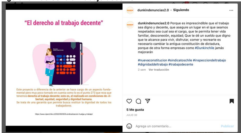
Figura 2: El derecho al trabajo decente