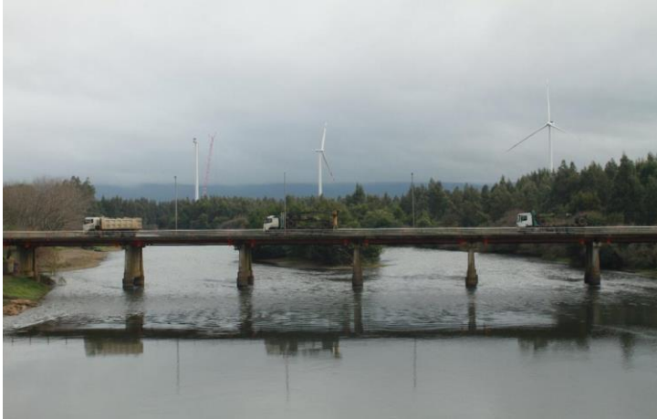
Imagen 1 Parques eólicos cercanos al Río Renaico