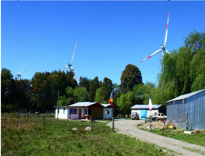
Imagen 3 Incumplimiento en el distanciamiento de aerogeneradores