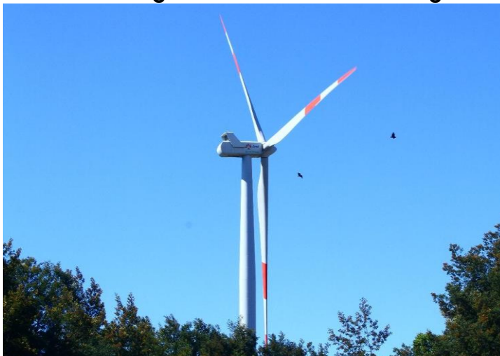
Imagen 2 Afectación de aerogeneradores sobre la ecología de aves