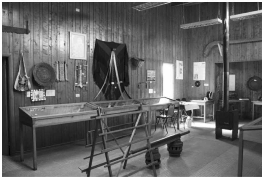
Figura 3. MDH 2017 - Interior del museo e información general

Fecha de creación: 2009, sin embargo desde 1973 se realizaba un trabajo de conservación y puesta en valor. Colecciones: geológica, biológica, osteológicas faunística, paleontológica e histórica. Usuarios frecuentes: comunidad universitaria y escolar. Visitas: No llevan libro de visitas.