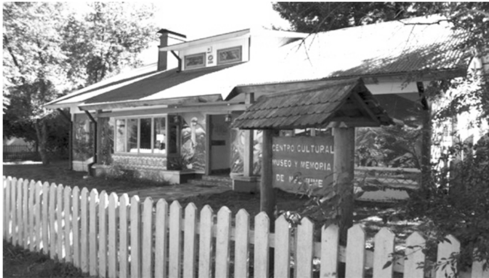
Figura 2. CCMMN 2018 - Exterior del museo e información general