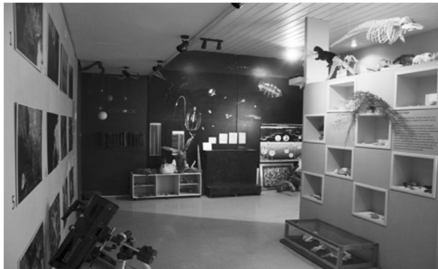
Figura 4. MEHG 2017 - Interior del museo e información general

Fecha de creación: 2009, sin embargo desde 1973 se realizaba un trabajo de conservación y puesta en valor. Colecciones: geológica, biológica, osteológicas faunística, paleontológica e histórica. Usuarios frecuentes: comunidad universitaria y escolar. Visitas: No llevan libro de visitas.