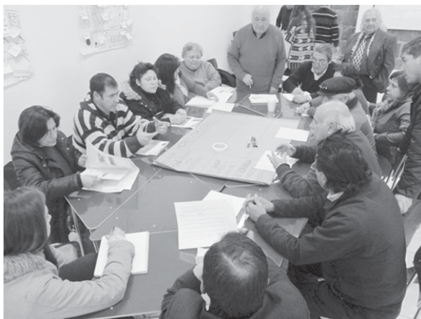
Imagen 3 Taller de trabajo, programa TAC (2014)