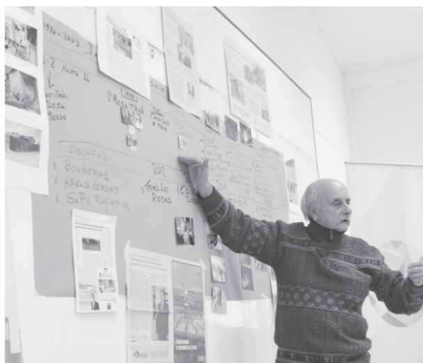
Imagen 4 Taller de trabajo, programa TAC (2014)