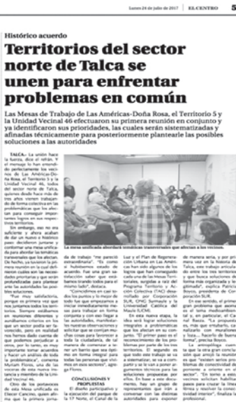
Imagen 7. Trabajo conjunto de las tres Mesas Territoriales