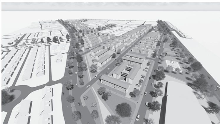
Imagen 6 Propuesta Master Plan Las Américas