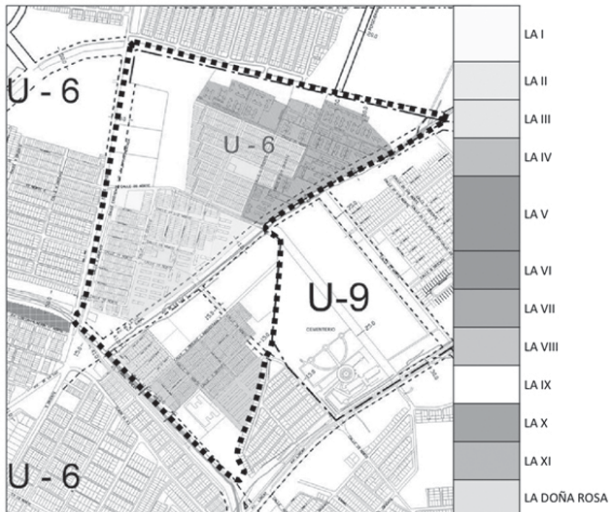
Imagen 2 Delimitaciones de la organización vecinal en Las Américas.