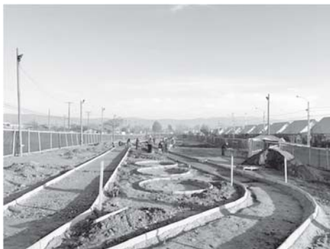
Imagen 5 Avance de obras del Parque 17 Norte

La primera de ellas es la construcción del parque denominado provisionalmente “17 Norte”, de una extensión de 12 mil metros cuadrados y una inversión cercana al medio millón de dólares. Por parte de la Municipalidad, este proyecto implicó la aprobación de una inversión que no estaba considerada inicialmente en el presupuesto; y, más relevante aún, consiguió que se modificara la lógica tradicional de inversión, centrada en micro intervenciones en villas y poblaciones y que otorgaban un mayor rédito político-electoral en el corto plazo, hacia un proyecto de mayor envergadura en un espacio territorial más amplio. Para los vecinos y sus organizaciones, el desafío fue también cambiar la lógica de reparto o competencia entre barrios para imaginar un proyecto de inversión a escala mayor. Por otro lado, hubo que consensuar la localización del nuevo parque: ¿dónde emplazarlo para producir un impacto equitativo en el territorio? La decisión que tomó la Mesa Territorial fue ubicarlo en un largo sitio eriazos que hacía de barrera entre la parte más antigua del territorio y la más nueva, buscando con esto “suturar” una división que se veía podría profundizarse. La localización de la inversión implicó una señal muy importante de articulación con la parte más pobre del territorio. Finalmente estuvo el diseño, que también fue comandado por los vecinos y por técnicos que ellos mismos propusieron; y la construcción, proceso que está en pleno desarrollo ( Imagen5 ).